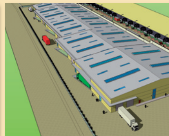
Study of the Hall